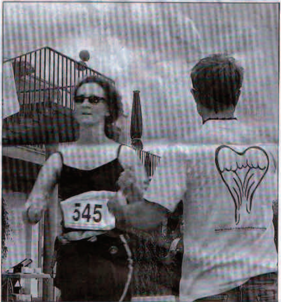
Und wieder ist eine Runde für den guten Zweck geschafft.